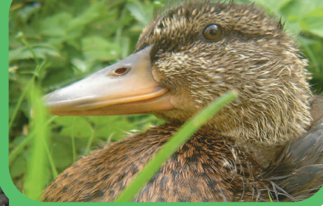
Die Ente Pina

Vogelpflegestation Oberdorfstr. 25 8274 Tägerwilen/Schweiz